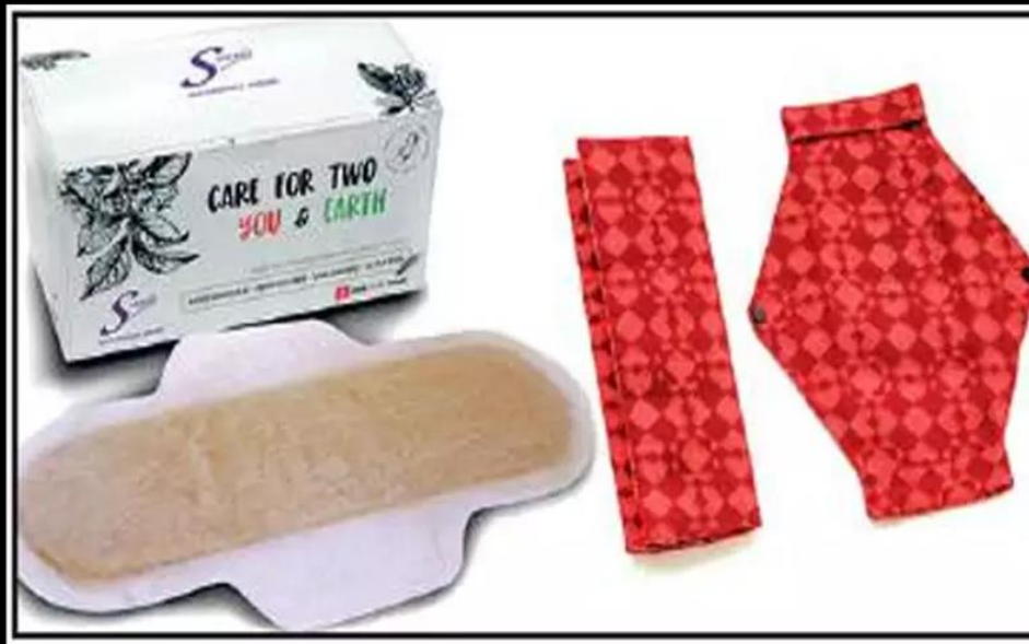
Saukhyam's reusable pads and Saathi's disposable ones are environment-friendly.