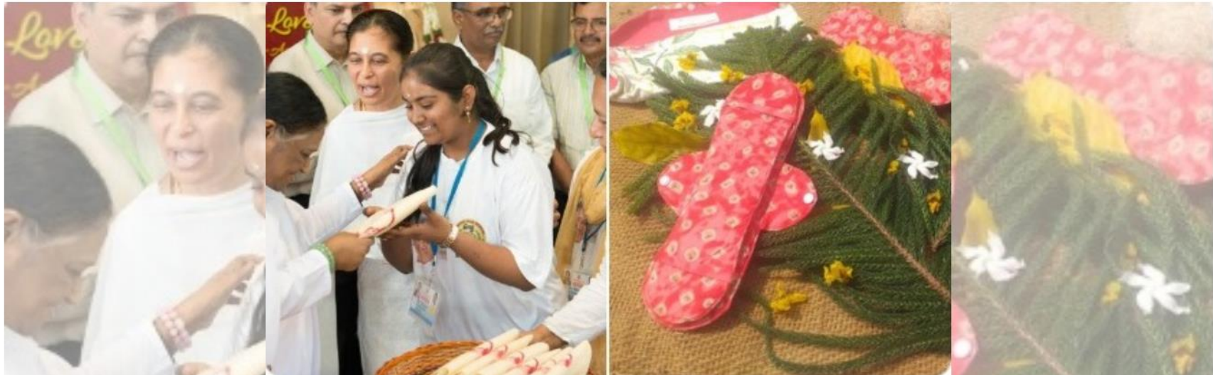
'Saukhyam' reusable pads, a Mata Amritanandamayi Math project, are made by women self-help groups in various states of the country in recognition of the brand's endeavour to empower women in rural areas.